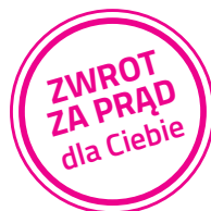
Tabela ofert oraz wysokości Bonusów dla Klientów Organizatora Programu

Program kliencki – oferta podstawowa z Bonusem